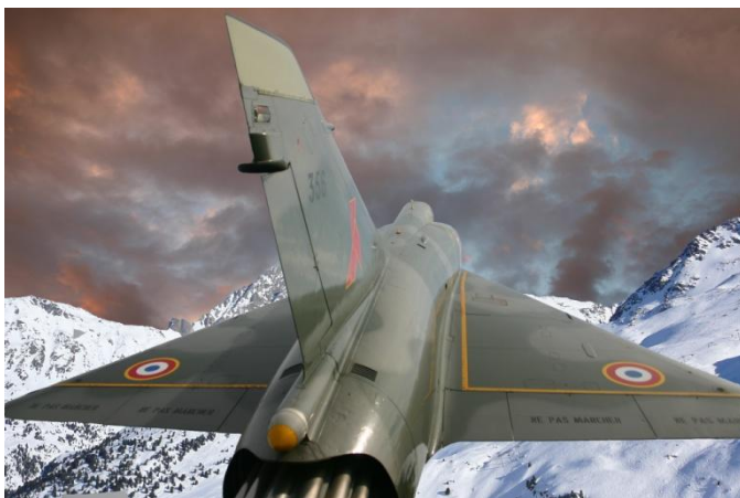
Démo 000 C

Finition au pinceau autour de l'avion de chasse.( Démo 000 C )