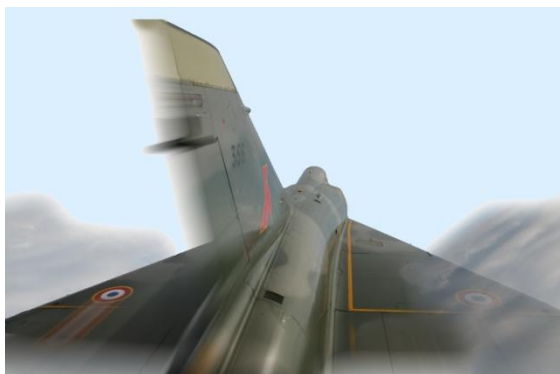
Démo 000 F